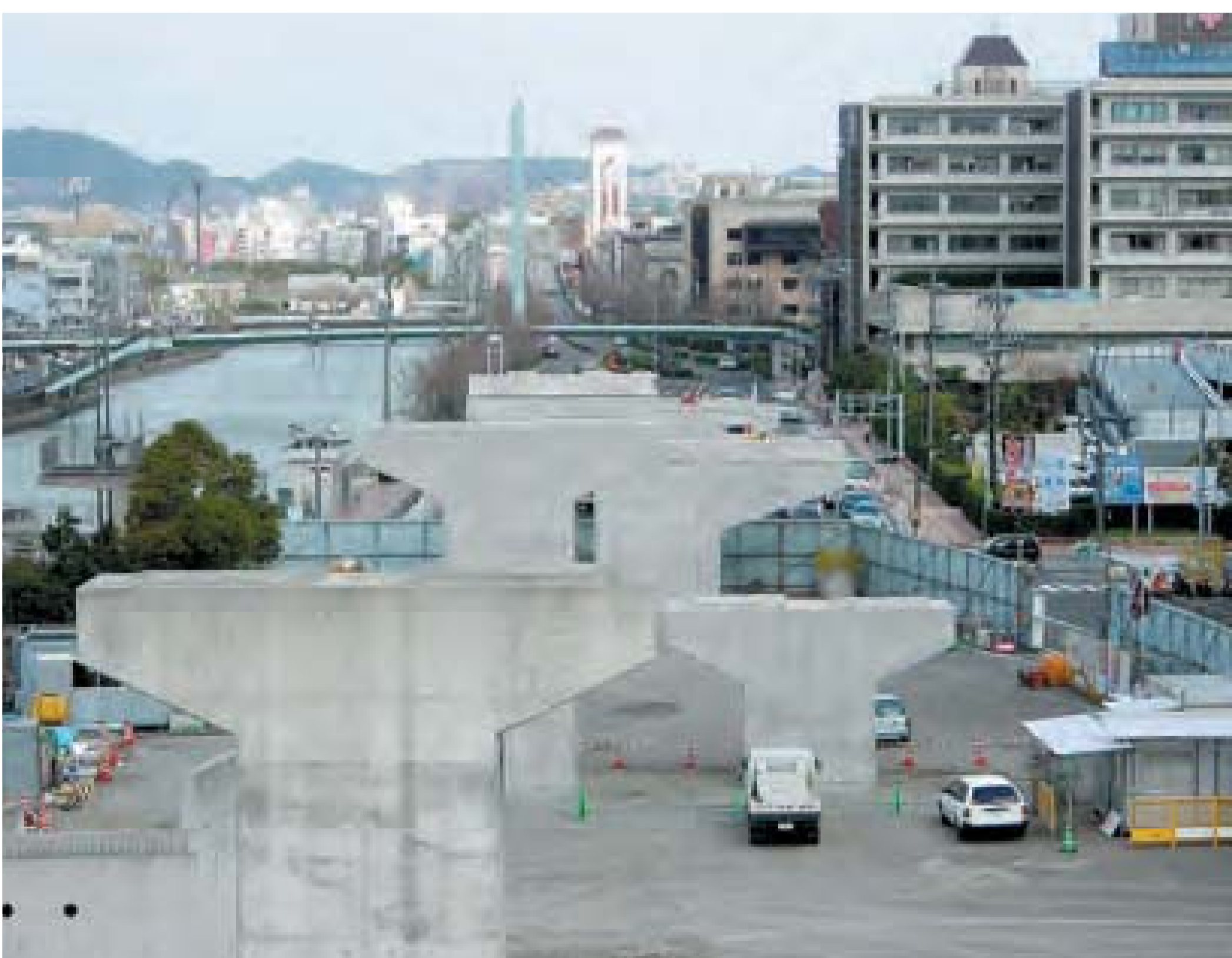
都市計画道路浦上川線