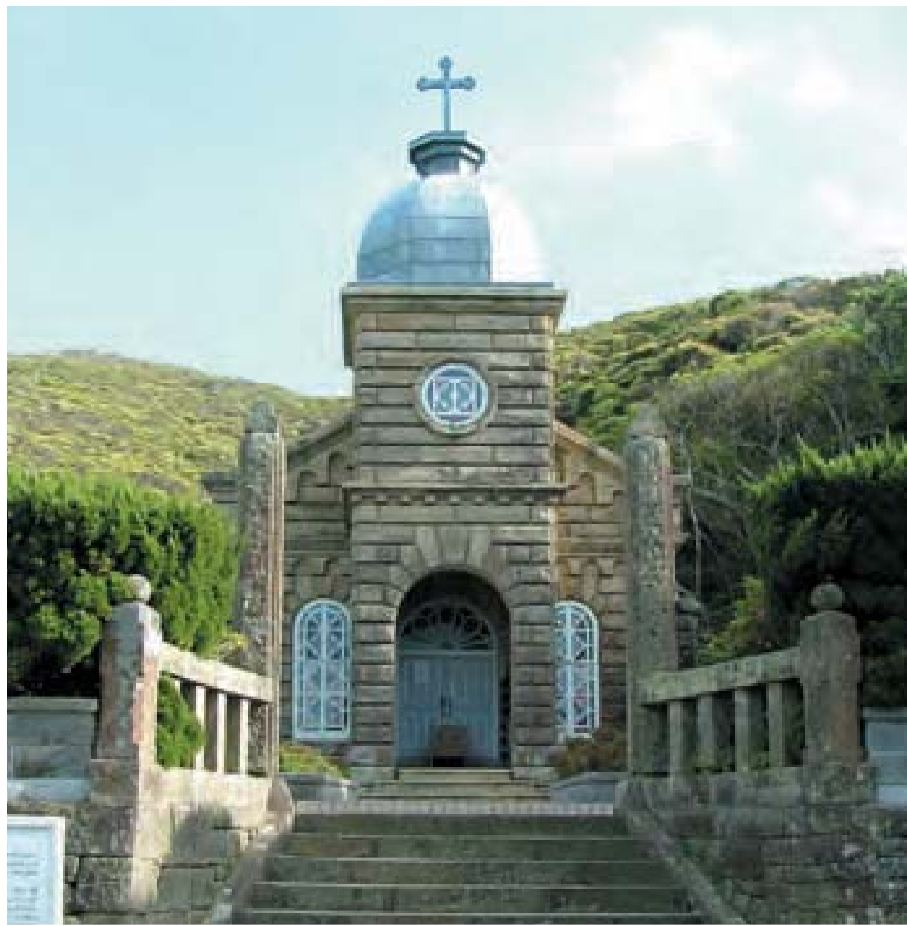
頭ヶ島教会(新上五島町)

世界遺産登録に向けた 公共施設修景事業 教会群周辺の公共事業のあり方に関するガイドラインを作成します。