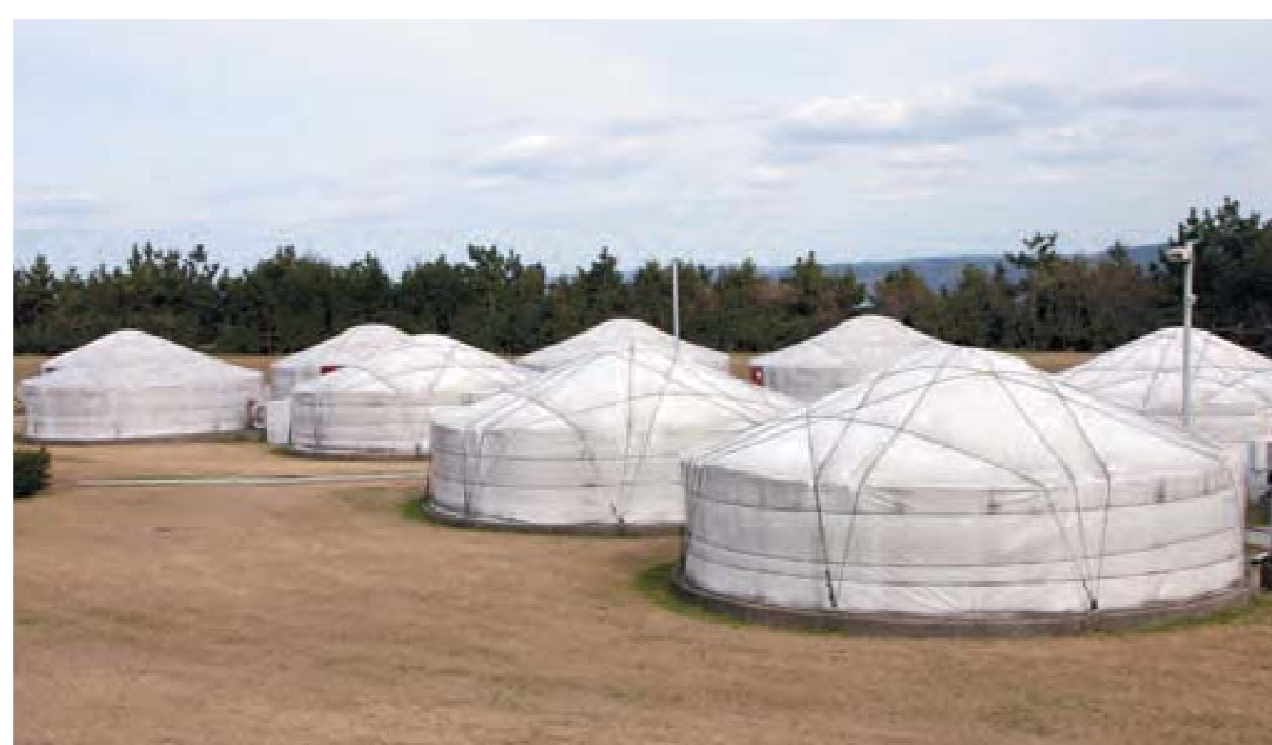
ゲルは泊まることもできます