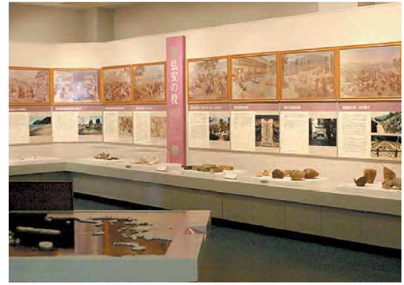
松浦市立歴史民俗資料館

遠く鎌倉時代「元寇」最後の戦場となった鷹島は、元寇の島とも呼ばれ、周辺の海域からは当時の戦をものがたる、壺や刀などの貴重な遺物が数多く発見されました。松浦市立歴史民俗資料館と隣接する鷹島埋蔵文化センターには、当時の様子を物語る貴重な文化財が多数展示されています。