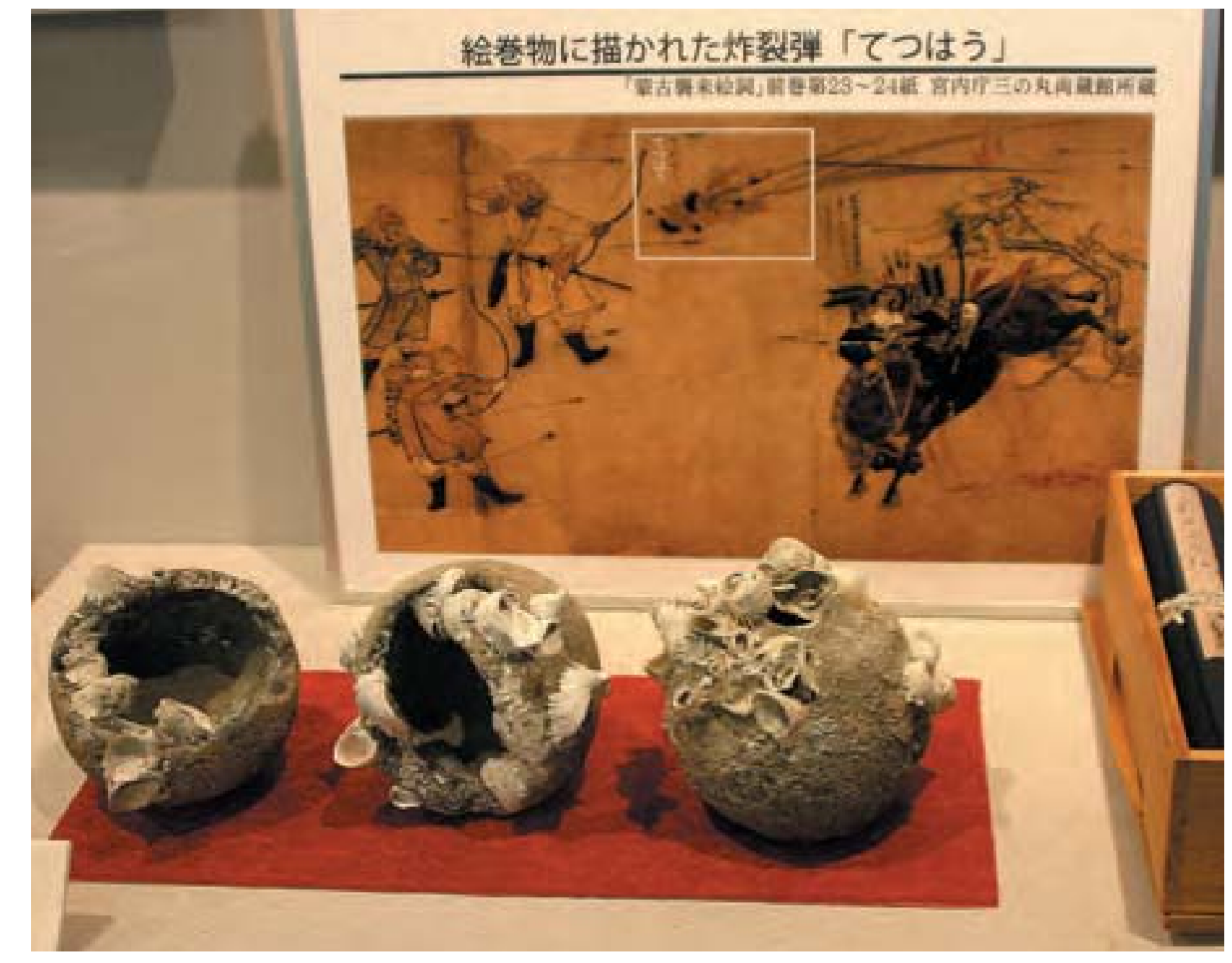
蒙古襲来時に使用された炸裂弾