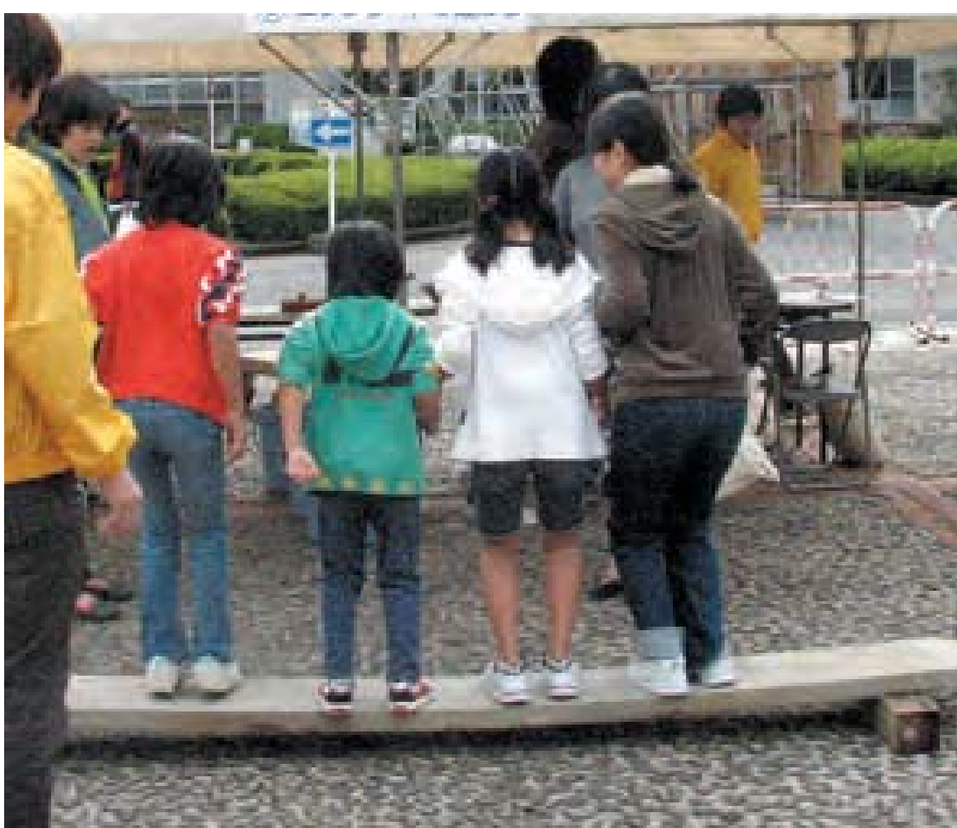
コンクリートで遊ぼう