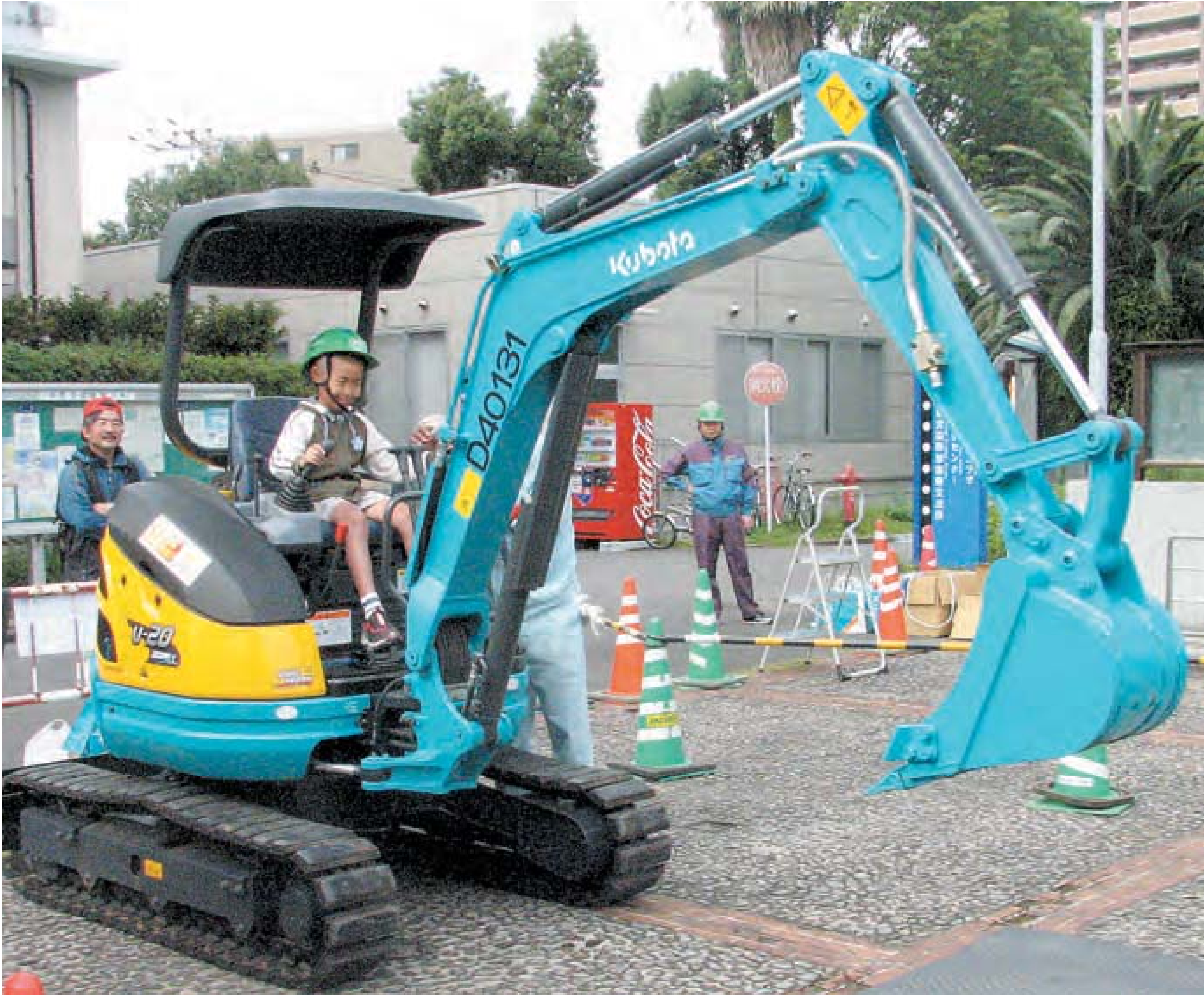
建設重機の操縦体験

長崎大学工学部の学生さんといっしょに土木に関する実験やものづくりを体験・学習できるイベント「テクノパワーおもしろ探検隊」を実施しました。小学校高学年から中学生まで、多くの皆さんに参加いただきましたが、なかでも建設重機の操縦体験は大好評でした。