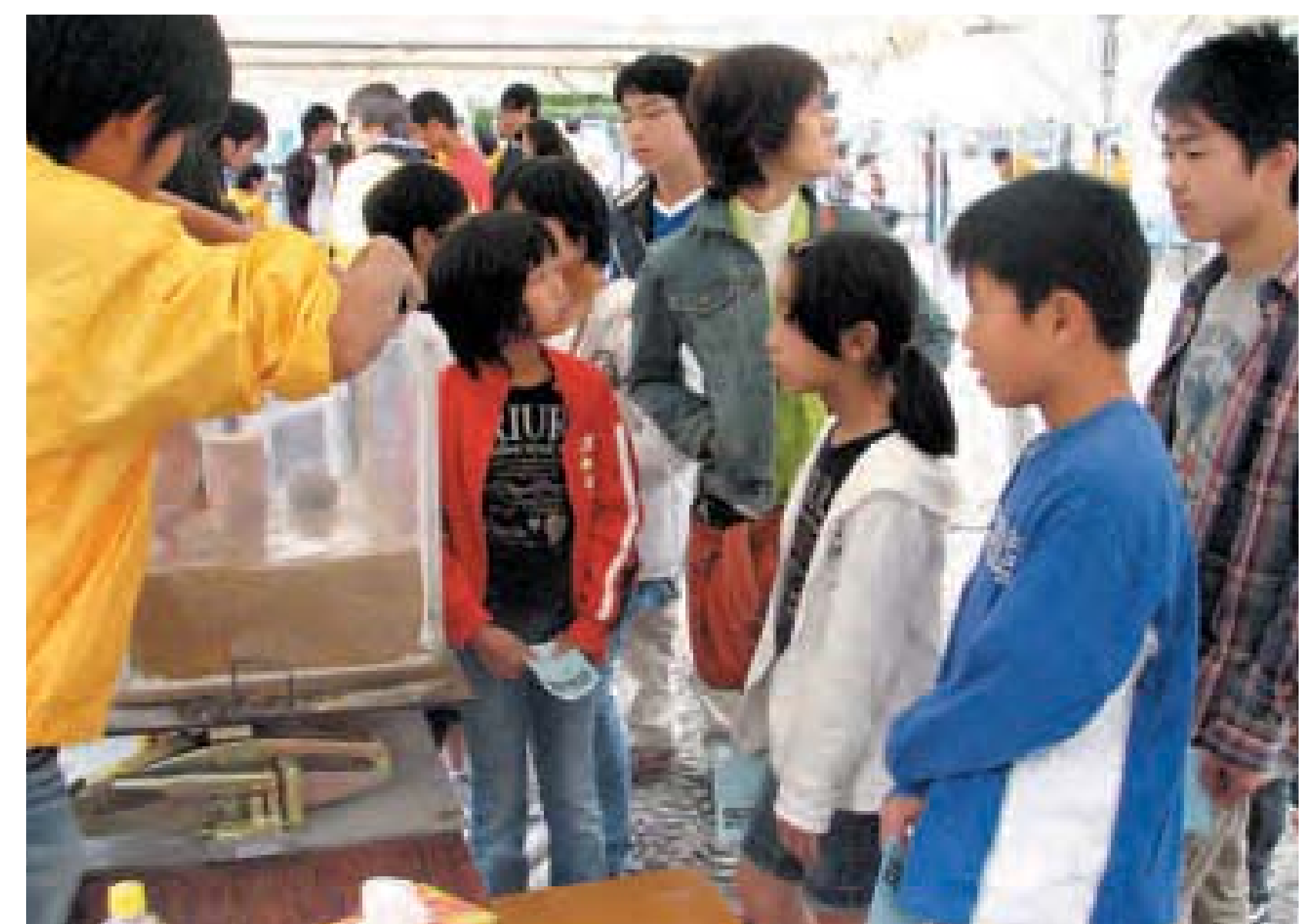
砂地盤の液状化実験