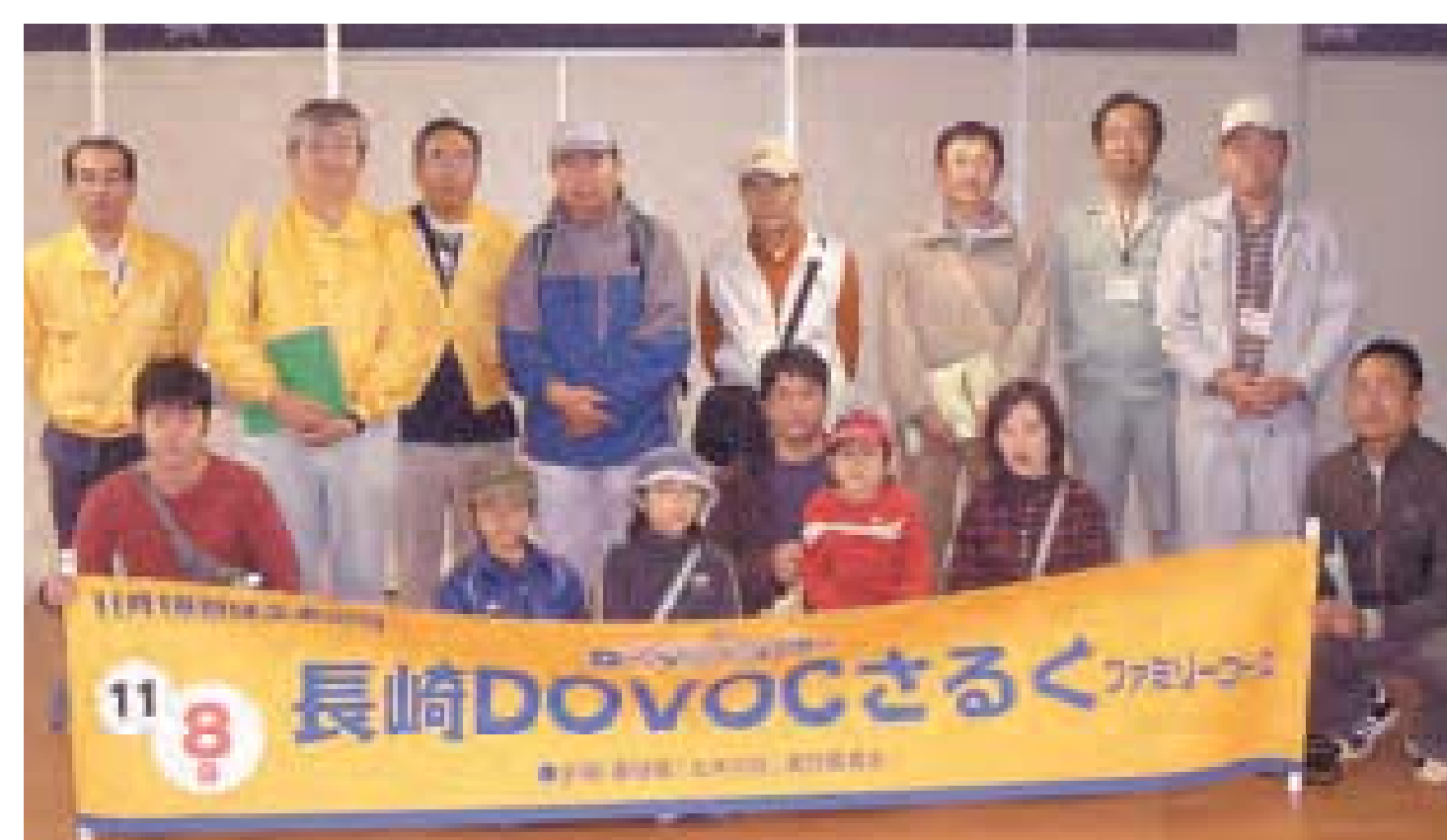
ファミリーコースに参加の皆さん