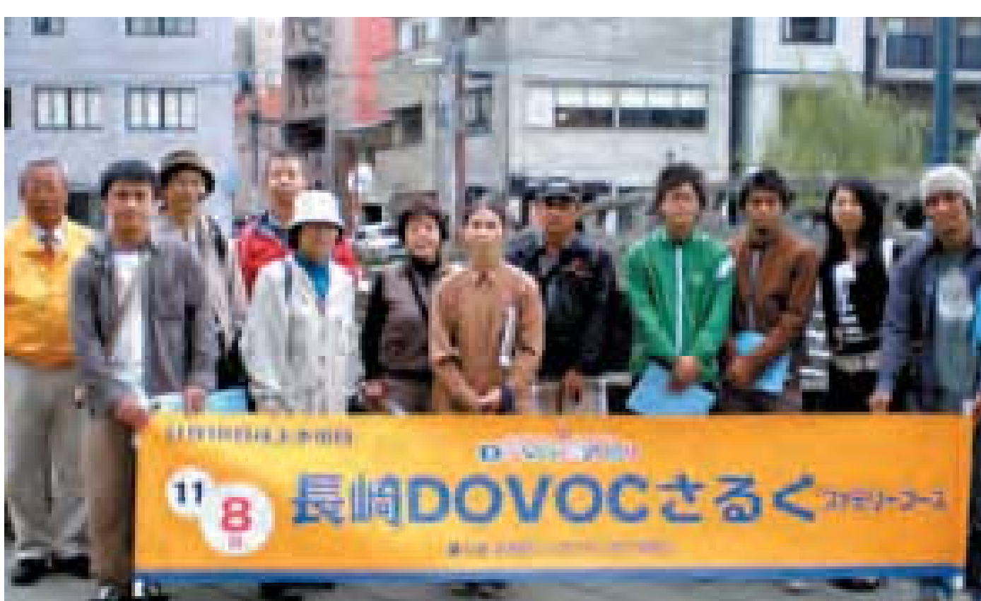
一般コースに参加の皆さん