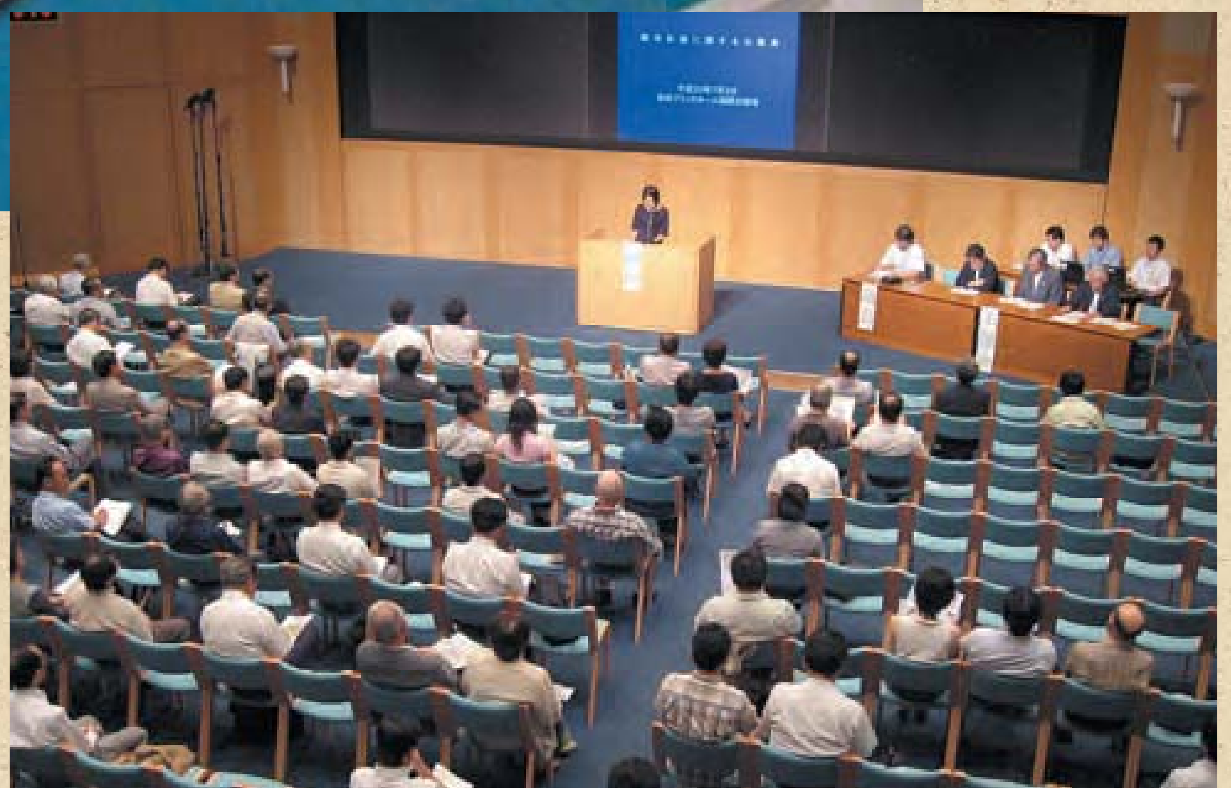
ブリックホールで行われた公聴会

◎長崎県の都市計画ホームページ http://www.doboku.pref.nagasaki.jp/~toshi/ ◎お問い合わせ 長崎県土木部まちづくり推進局都市計画課 TEL095-894-3033 FAX095-894-3462 MAIL toshikeikaku@pref.nagasaki.lg.jp