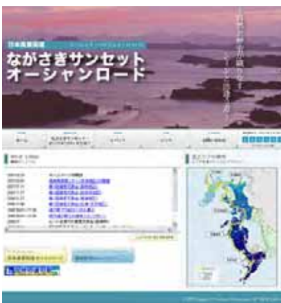
情報発信(ホームページ作成)

地域ならではの資源を活かして、来訪者を迎えるためのイベントや体験メニューを実施する「しかけ」づくりを進めます。