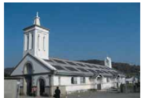
出津教会(長崎市海外)