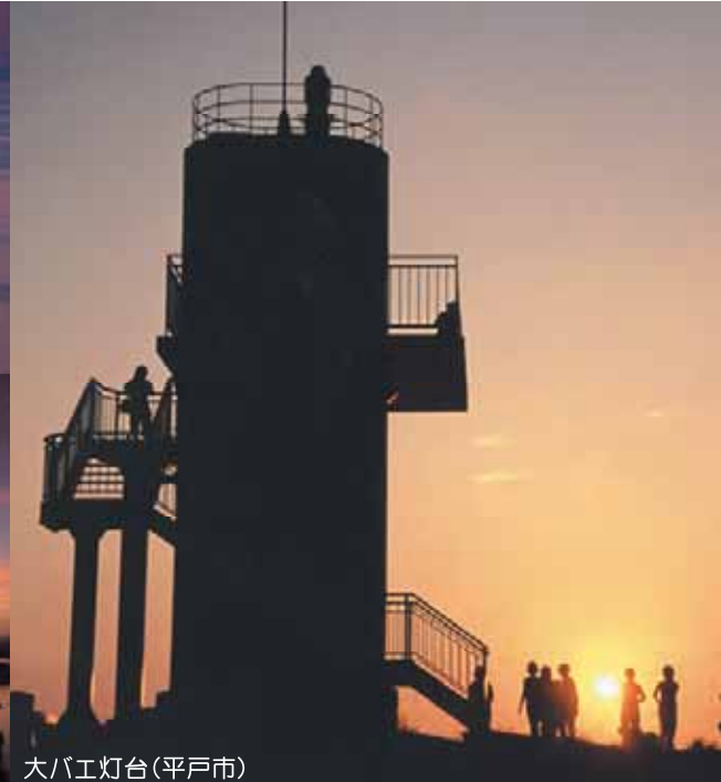
大バエ灯台(平戸市)