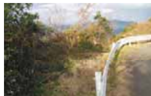
老朽化したガードレール

来訪者をお迎えするため、案内板の整備、※シーニックデッキ、ルート沿いの植栽などの「舞台」づくりを進めます。