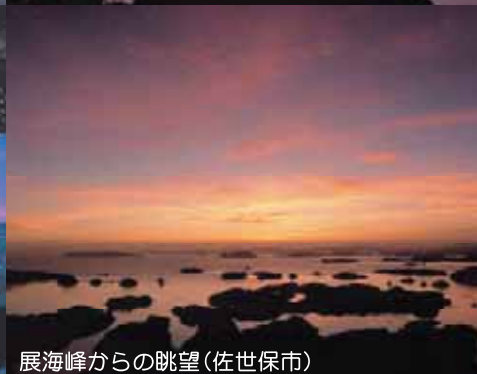
展海峰からの眺望(佐世保市)