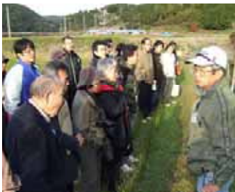
手づくりイベント(雪浦ウィーク)

この4つの方針のもと、各活動団体の一体感を高め、ルート沿いの美しい風景づくりや生き生きとした地域づくりを具体化し、それぞれの活動が連携していくことで、地域全体の魅力がさらに増していくと考えています。