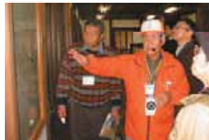
地域再発見バスツアー