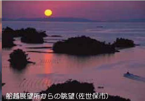
船越展望所からの眺望(佐世保市)