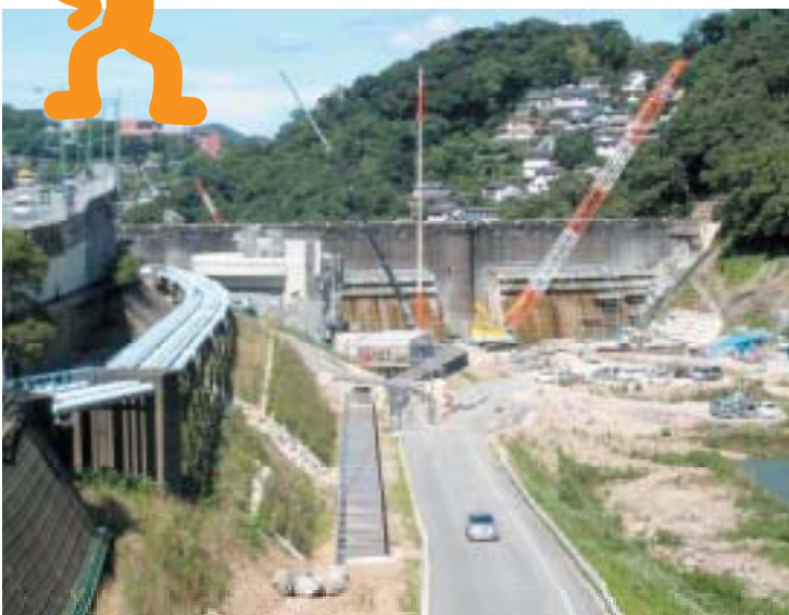
本河内低部ダム(長崎市)