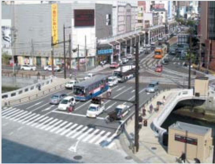
中島川河川改修事業(中央橋架替)(長崎市)