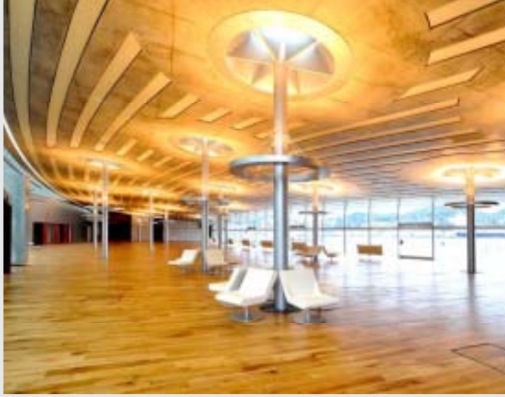
長崎港松が枝国際ターミナルビル(長崎市)