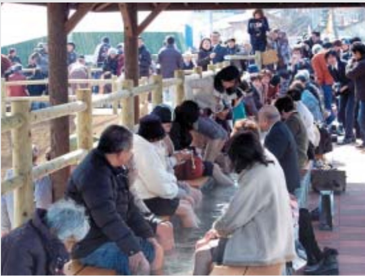
小浜港みんなのふるさとふれあい事業(雲仙市)