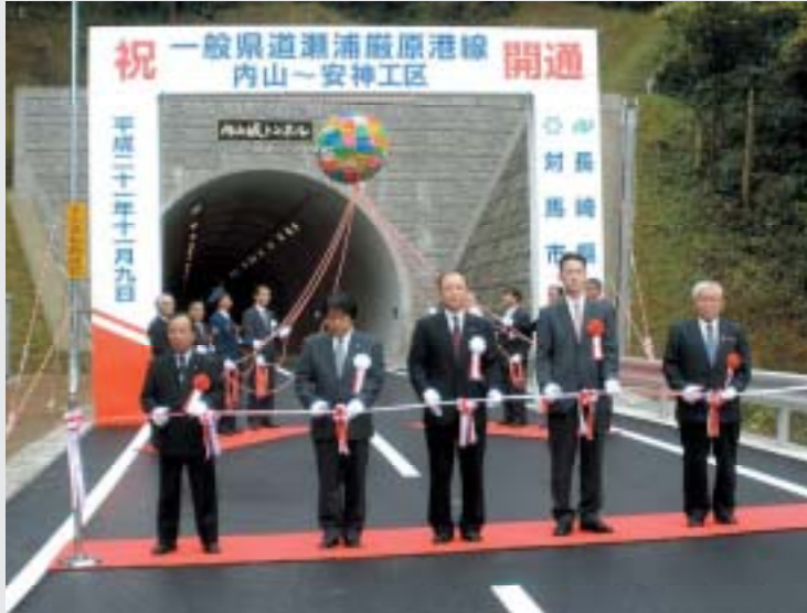
一般国道瀬浦厳原港線(厳原町内山工区)(対馬市)