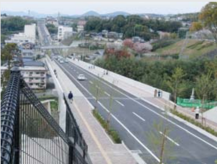
久原池田線(大村市)