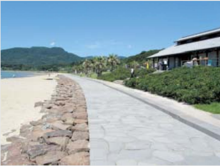
川内港海岸環境整備事業(平戸市)