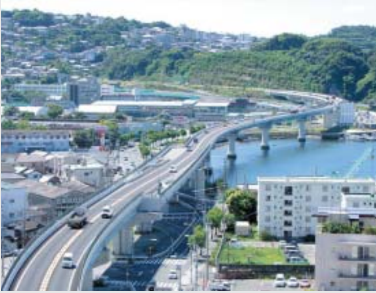
西九州自動車道(佐世保みなとIC～相浦中里IC) (佐世保市)