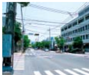
整備前 浦上警察署付近

電力や通信のケーブルなどの電線類を地中化することにより、歩行空間を確保し安全で快適な道づくりを目指します。また、良好な都市景観・歴史的な街並みの保全が特に必要な地区においては面的な整備を実施します。