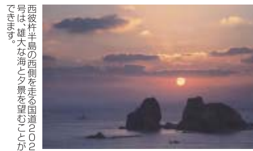
国道202号(長崎市式見)