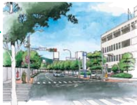
整備後 イメージ 長与大橋町線 浦上警察署付近