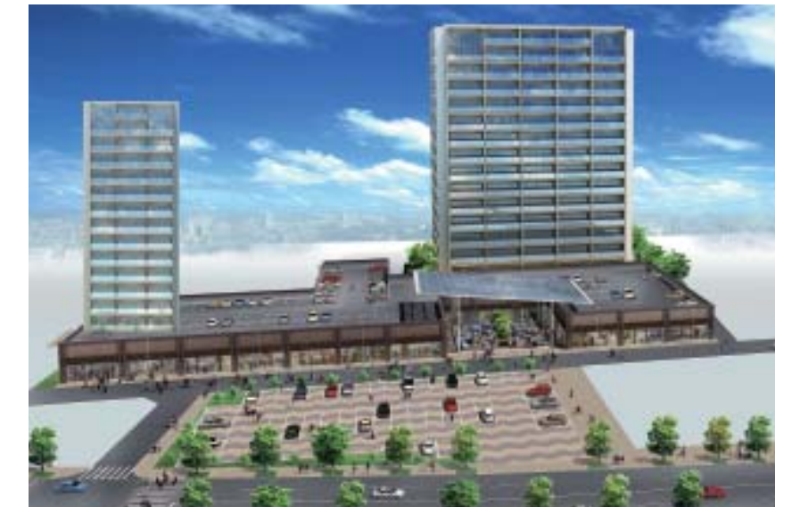
上駅通り地区第一種市街地再開発事業