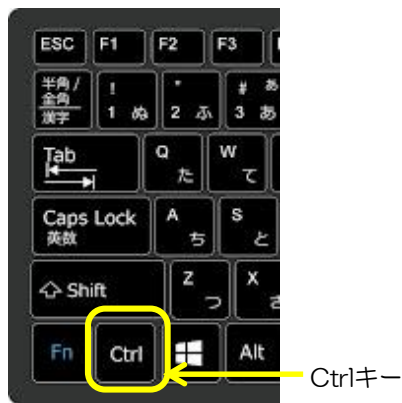
キーボードのキー配列図（一部抜粋）

下記④のように印刷メニュー画面が表示されますので、そこから【印刷】ボタンをクリックして印刷してください。