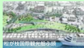
松が枝国際観光船ふ頭

現在、長崎港では松が枝ふ頭の国際ターミナルビルや、小ヶ倉柳地区でコンテナふ頭を整備中です。