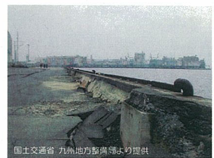
福岡県西方沖地震による岸壁の被災状況 ・ 耐震性にすぐれた岸壁の整備 ・ 液状化対策