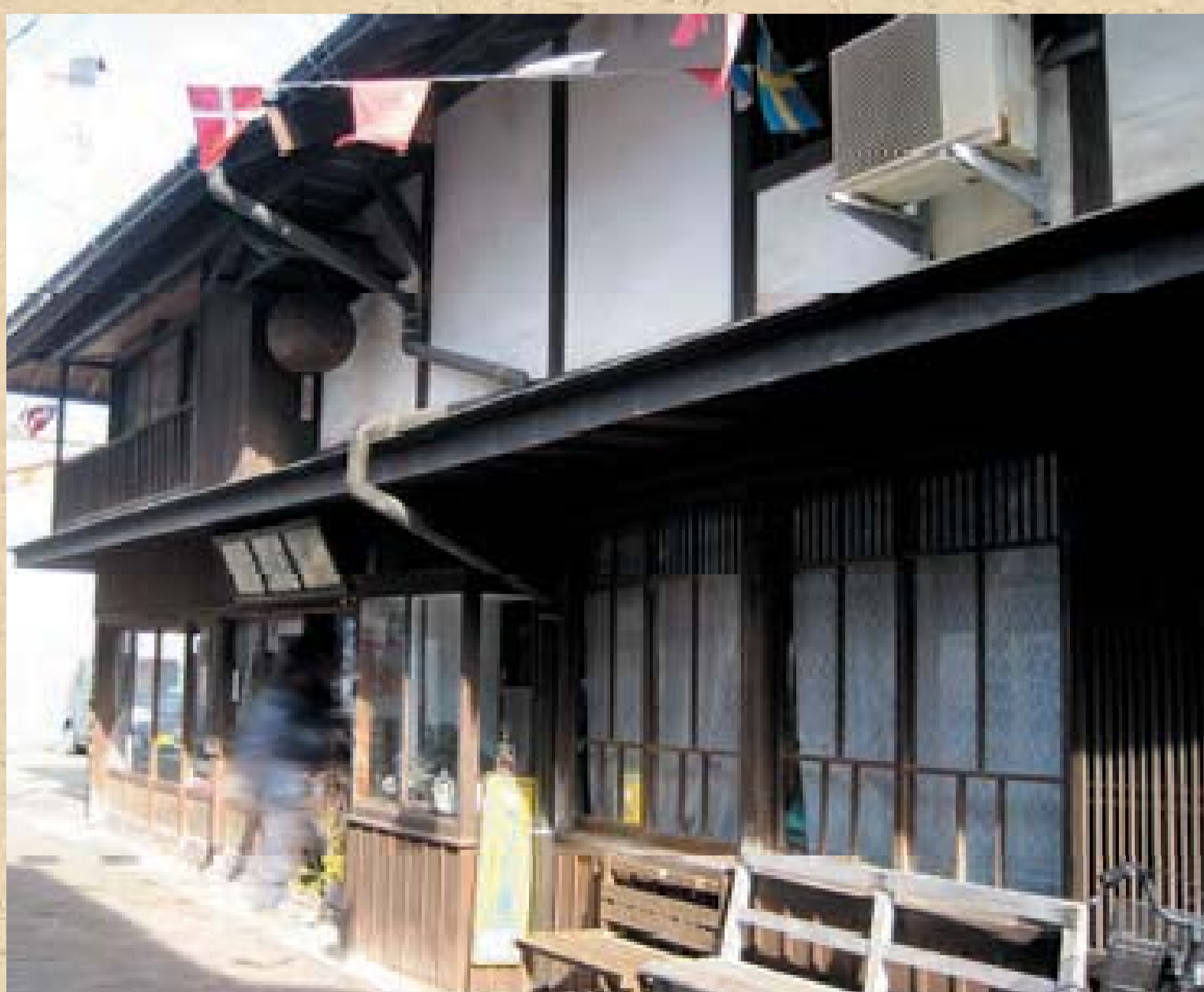
格子戸とばんこのある商家

岐には北部の勝本浦の他に、芦辺町の漁業集落や最近注目の一支国博物館、石田町の筒城浜、壱岐市の中心部である郷ノ浦町など、全島に観光ポイントが分散しています。一日かけてのんびり島内を巡ると、島のスローライフが体験できることでしょう。