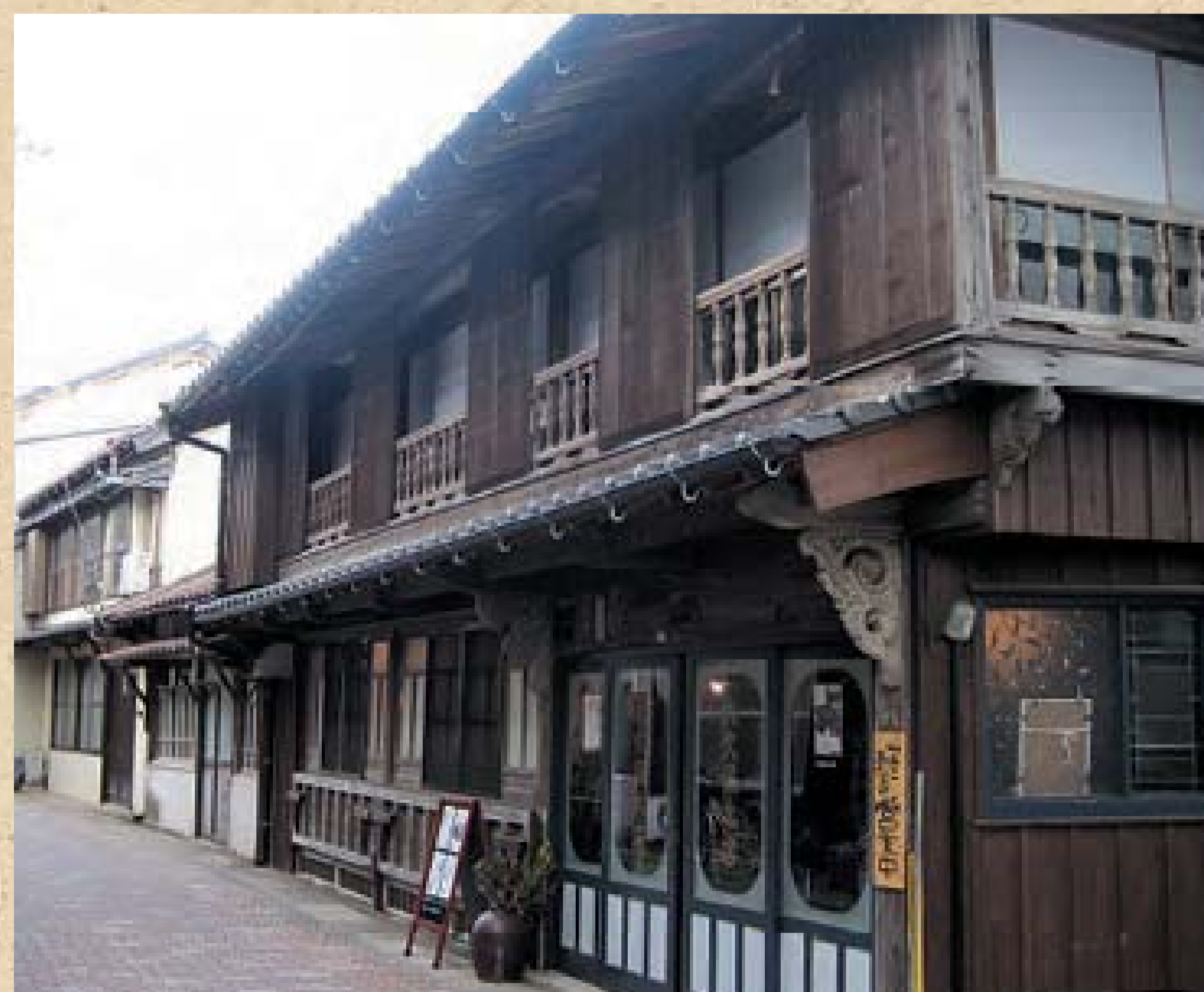
手すりや持ち送りのある藤嶋家