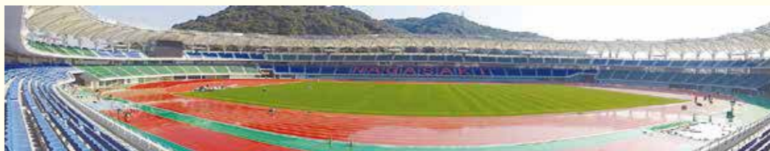
南西から北東を望む