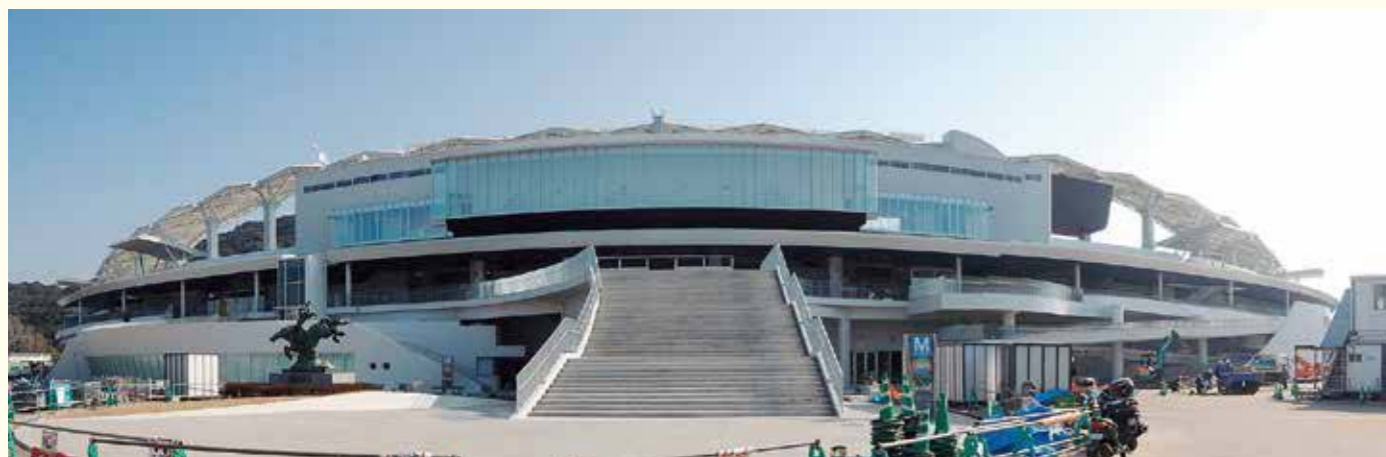
メインスタンド正面