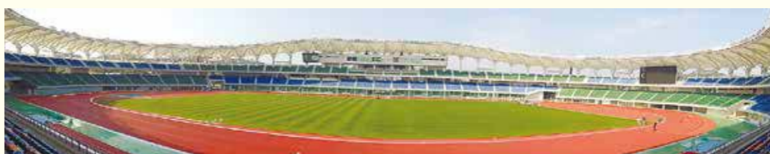
北東から南西を望む

平成26年(2014年)の第69回国民体育大会のメイン会場として県立総合運動公園(諫早市)の陸上競技場が生まれ変わります。この競技場は、旧競技場が建設から約40年経過して老朽化が進んだことや、国体競技場の基準に合わなくなったために建替となりました。供用開始は平成25年3月3日です。ぜひ県立総合運動公園に足を運んでみてください。