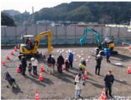
風船割り（バックホウ）