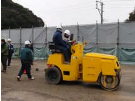
ロードローラ試乗体験