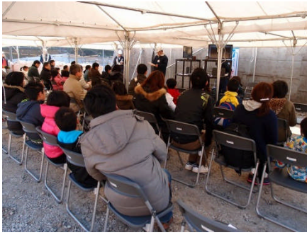
主催者挨拶（日迫所長）