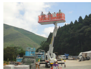
▲高所作業車試乗体験。大人も参加して一番人気だった。