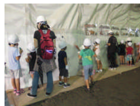
▲防水シートへのお絵かき