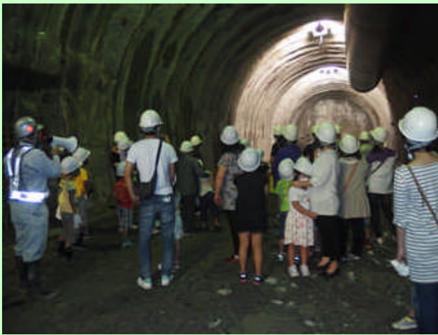
▲ 掘削先端部へ到着（坑口から1,775m地点）