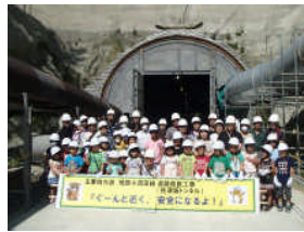
▲坑口前での記念撮影

○ ここでは、土砂置き場防音ハウスやコンクリートプラント、濁水処理設備などの役割を説明した後、トンネル坑口へ移動し、参加者全員揃っての1回目の記念写真撮影。