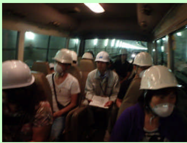
▲ トンネル延長が長いバス移動。車中にてトンネル内の状況を説明。