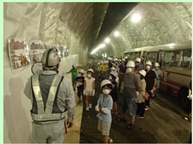
▲ 施工業者の紙芝居形式によるトンネル施工手順の説明。子供向けに軽快な説明口調が興味を引いていた。