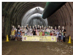
▲トンネル掘削先端部での記念撮影