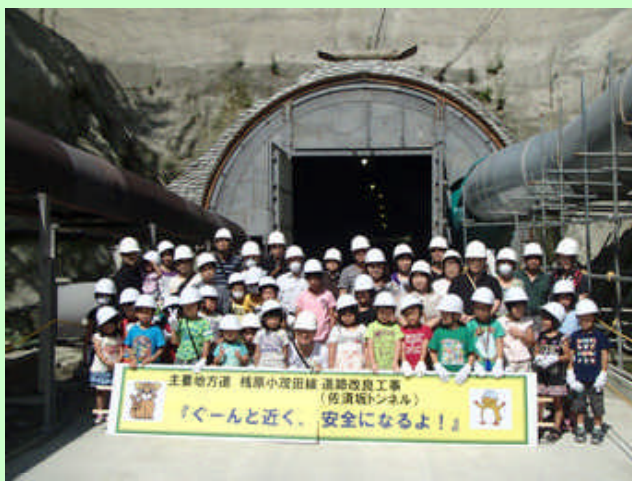
▲ 坑口にて記念撮影。