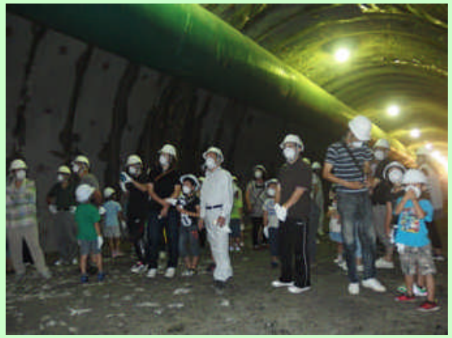
▲ 初めて見る工事中のトンネル内の様子を興味深く見ていた。