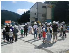
▲施工ヤード内の見学風景