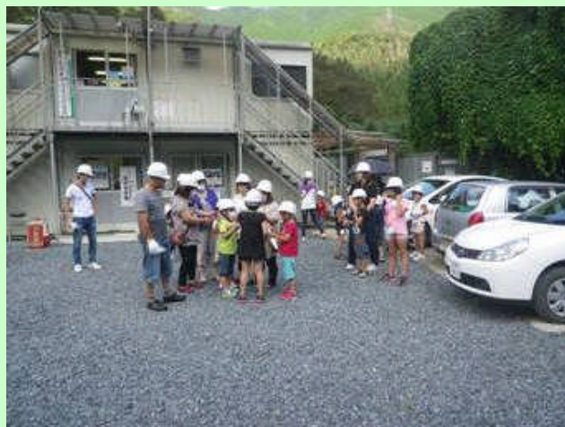
▲ 現場事務所にて、事業概要、見学に際しての注意事項を説明した後、現場ヘルメットを着用して見学に向けて準備している様子。