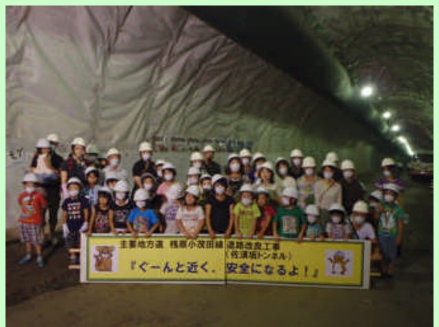
▲ 防水シートお絵かき前にて記念撮影。