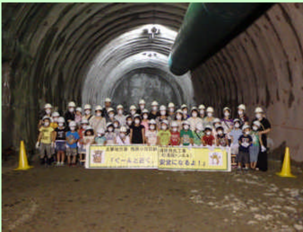
▲ 掘削先端部にて記念撮影。