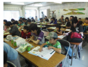
▲アンケートを記入する参加者