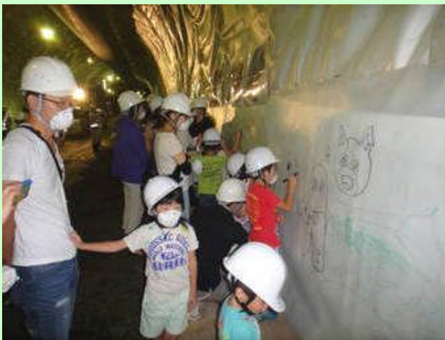
▲ 防水シートにお絵かき。皆さん思い思いの絵や文字をたくさん書いていた。（坑口から約1,300m地点）