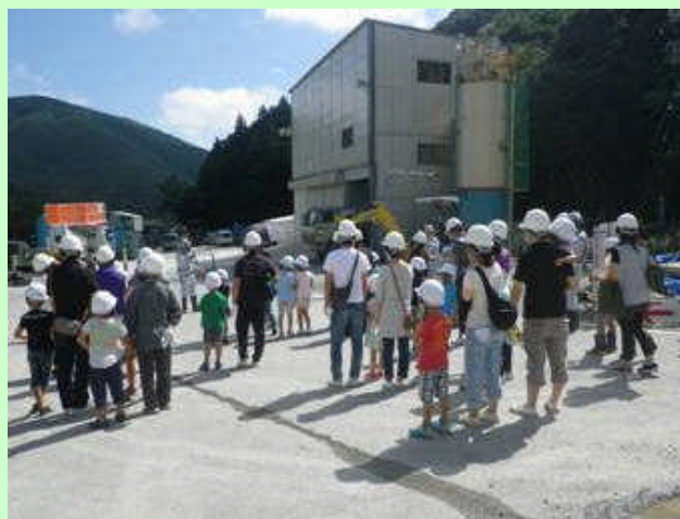
▲ 仮設ヤード内のベルトコンベア防音ハウス、コンクリートプラント、濁水処理設備等を見学しながら、トンネルへ。