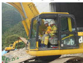
▲重機3台による試乗体験子供たちは楽しそうだった。