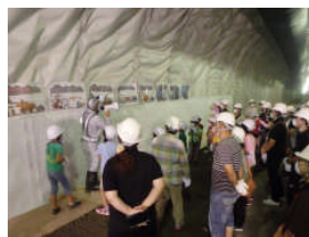
▲紙芝居形式による説明