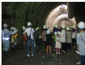
▲トンネル掘削先端部見学風景