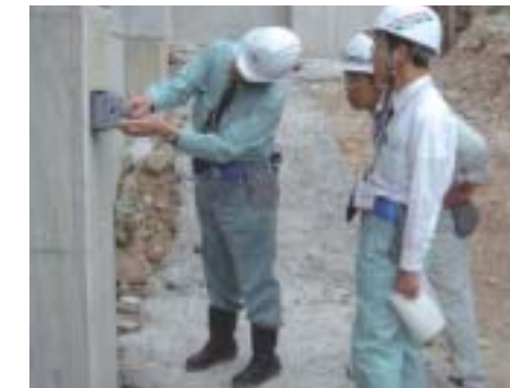
現場審査状況 RCレーダーで 鉄筋間隔、かぶり を調べています

良い品質の公共施設を作るために、施工体制点検の強化を図っており、監督職員と県が委託する長崎県建設技術研究センターの専門の職員と連携して適正な施工体制、品質管理状況、安全管理状況等について指導・監督しています。