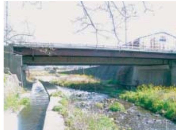
一般国道251号 吾妻橋 落橋防止