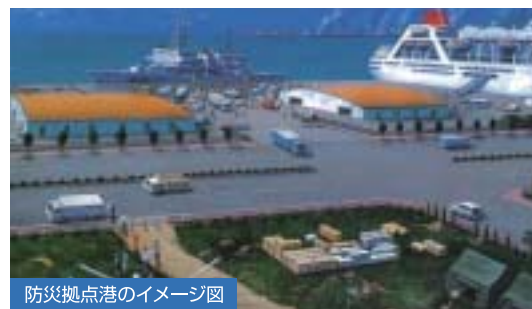
防災拠点港のイメージ図