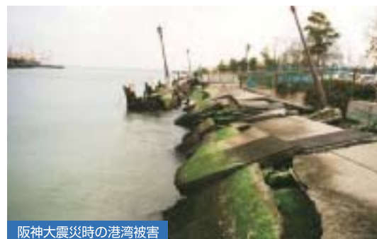
阪神大震災時の港湾被害