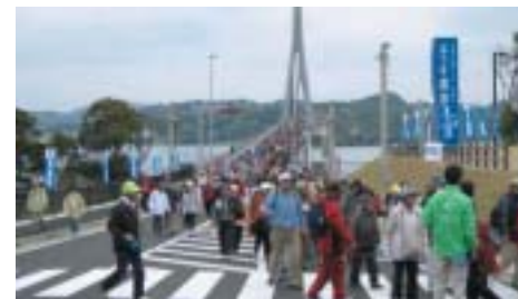
松浦市 鷹島肥前大橋（鷹島肥前大橋開通記念ウォーク）