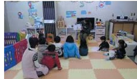
川棚町 空き店舗を活用した交流施設「ハッピーハウス」 (絵本の読み聞かせ)

・まちづくり協働プラン策定地区 島原市アーケード商店街周辺地区、平戸市大島村地区、松浦市鷹島地区、対馬市比田勝周辺地区、五島市福江商店街及びその周辺地区、雲仙市千々石地区、南島原市有家地区、東彼杵町彼杵宿地区、川棚町川棚駅周辺地区、新上五島町奈良尾地区