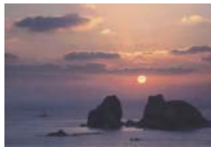
国道202号(長崎市式見) 西彼杵半島の西側を走る国道202号は、雄大な海と夕景を望むことができます。

ながさきサンセットオーシャンロードホームページ http://www.doboku.pref.nagasaki.jp/~n-fukeikaidou/