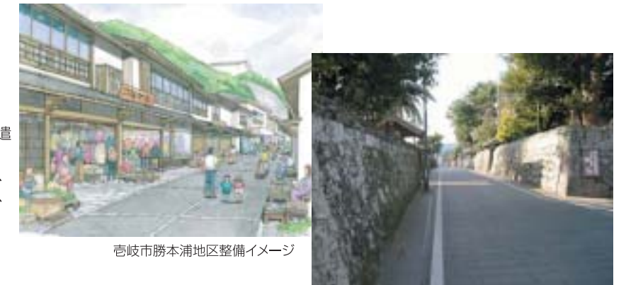
吉崎市勝本浦地区整備イメージ