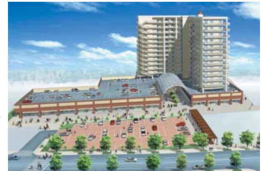
上駅通り地区第一種市街地再開発事業