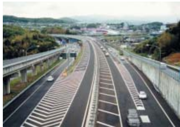
西九州自動車道（佐世保大塔IC～佐世保みなとIC間）

高規格幹線往路の整備により、福岡をはじめとする九州の主要都市や本州との高速交通による時間短縮、定時性の確保、快適性等が格段に向上します。