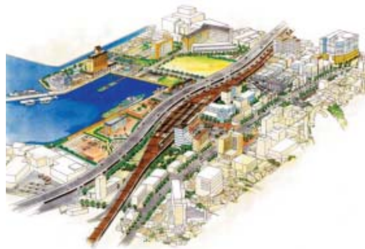
佐世保駅周辺の西九州自動車道完成予想図