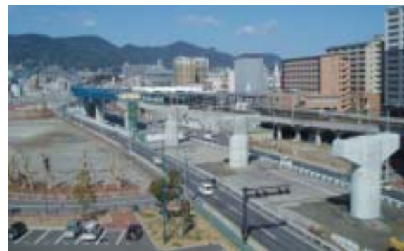
西九州自動車道（佐世保みなとIC～佐世保中央IC）